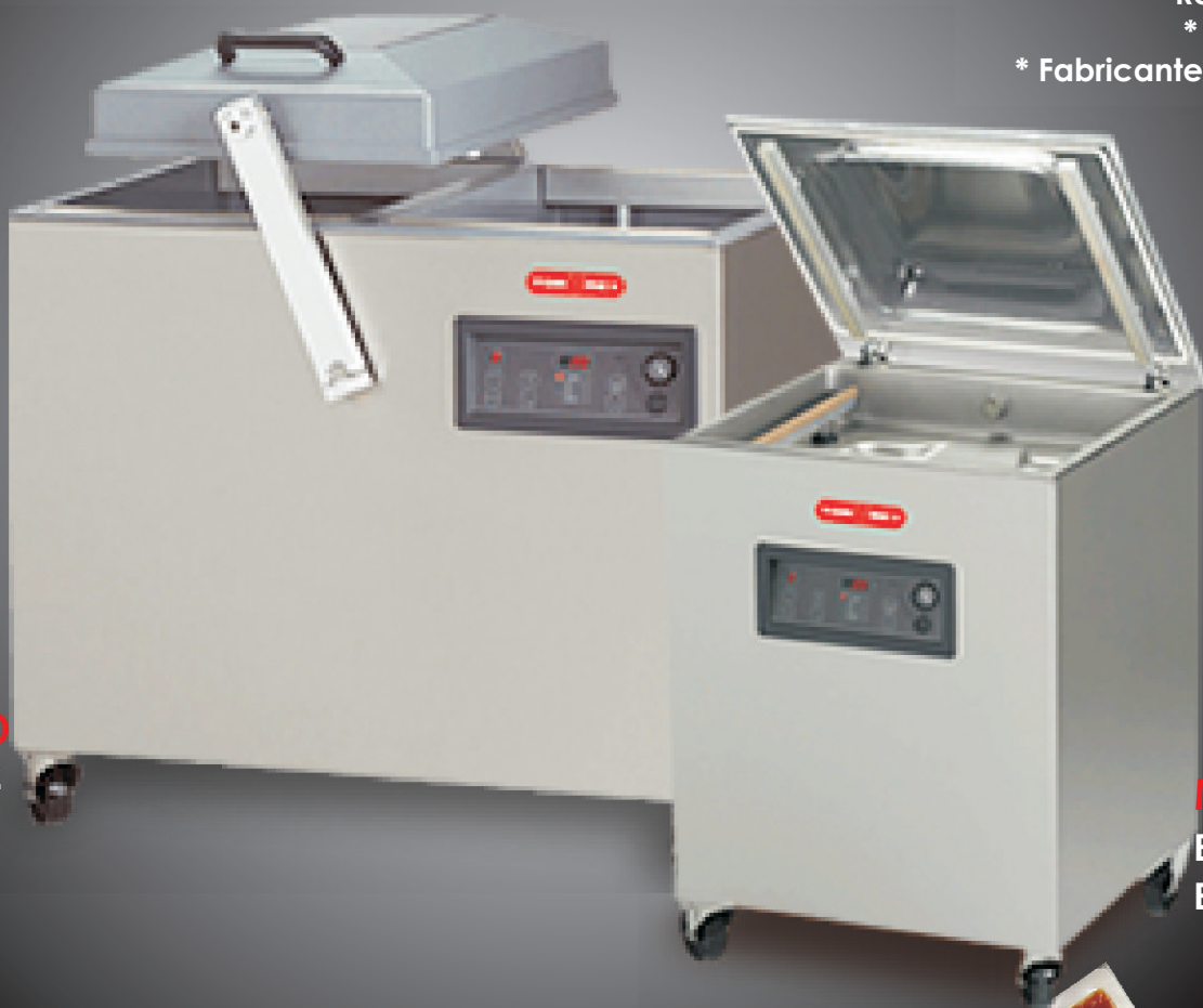
MODELO EVD-48 EVD-76

Cámara amplia con 2 y 4 barras de sellado, según modelo Gran capacidad de producción de empaques Cubierta alta para productos grandes Completamente automática Bomba alemana Busch muy confiable